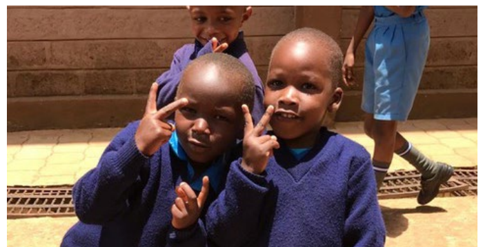
Good News Centre Kenya ondersteunt de beste leerlingen vanaf Primary School tot en met de universiteit.

Een jaar langer onderwijs volgen komt simpel gezegd neer op een stijging van ruim 10% aan kosten. Met gelijkblijvende inkomsten uit uw giften betekent dat, dat we zo'n 9 leerlingen niet meer zouden kunnen ondersteunen. Kortom, uw steun blijft enorm belangrijk voor onze Stichting.